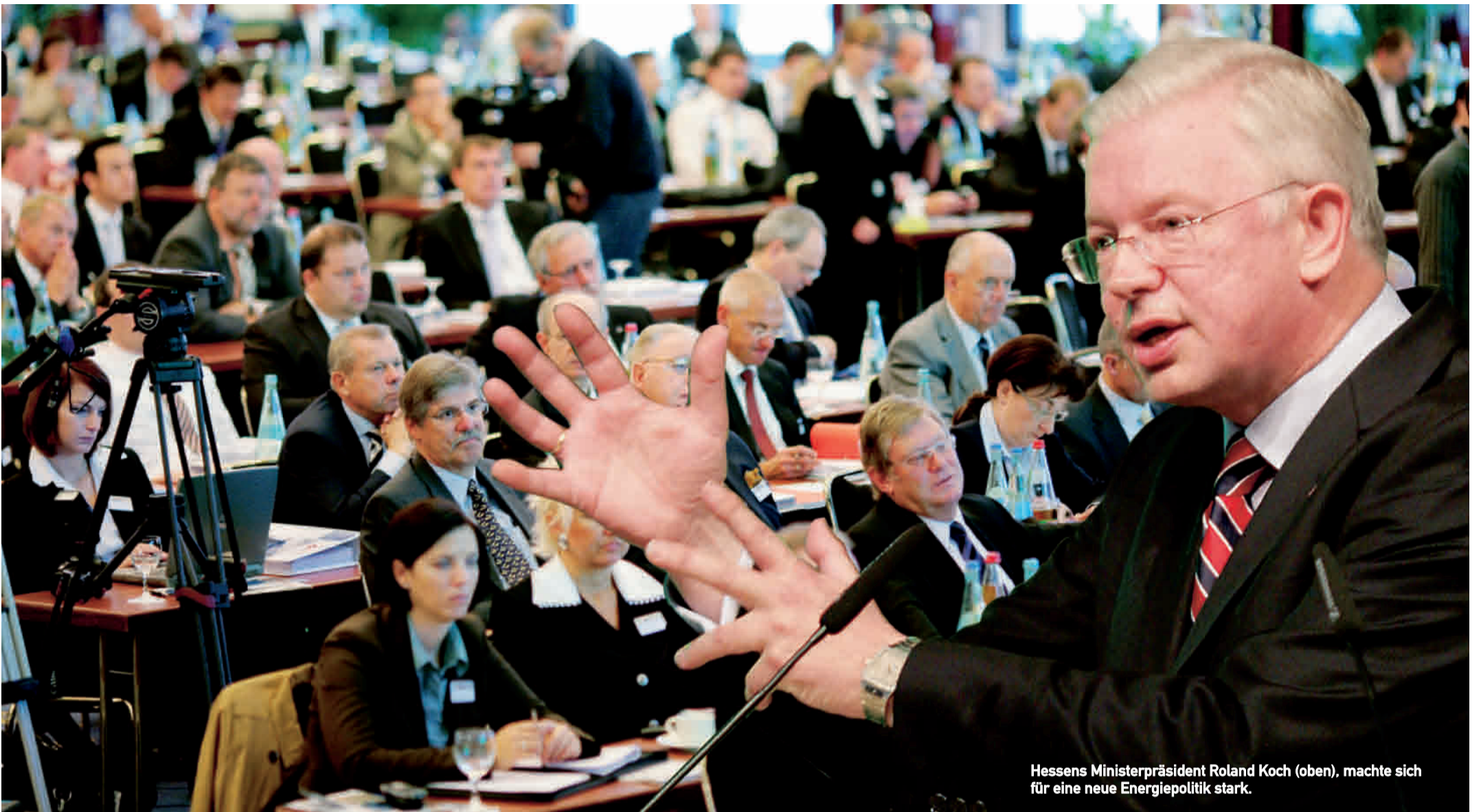
Hessens Ministerpräsident Roland Koch (oben), machte sich für eine neue Energiepolitik stark.