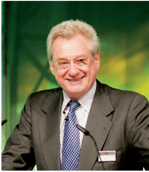
Wie gerade Familienunternehmen in der Krise profitieren können, skizzierte Dr. Heinrich Weiss, Vorsitzender der Geschäftsführung der Düsseldorfer SMS GmbH in seinem Vortrag.