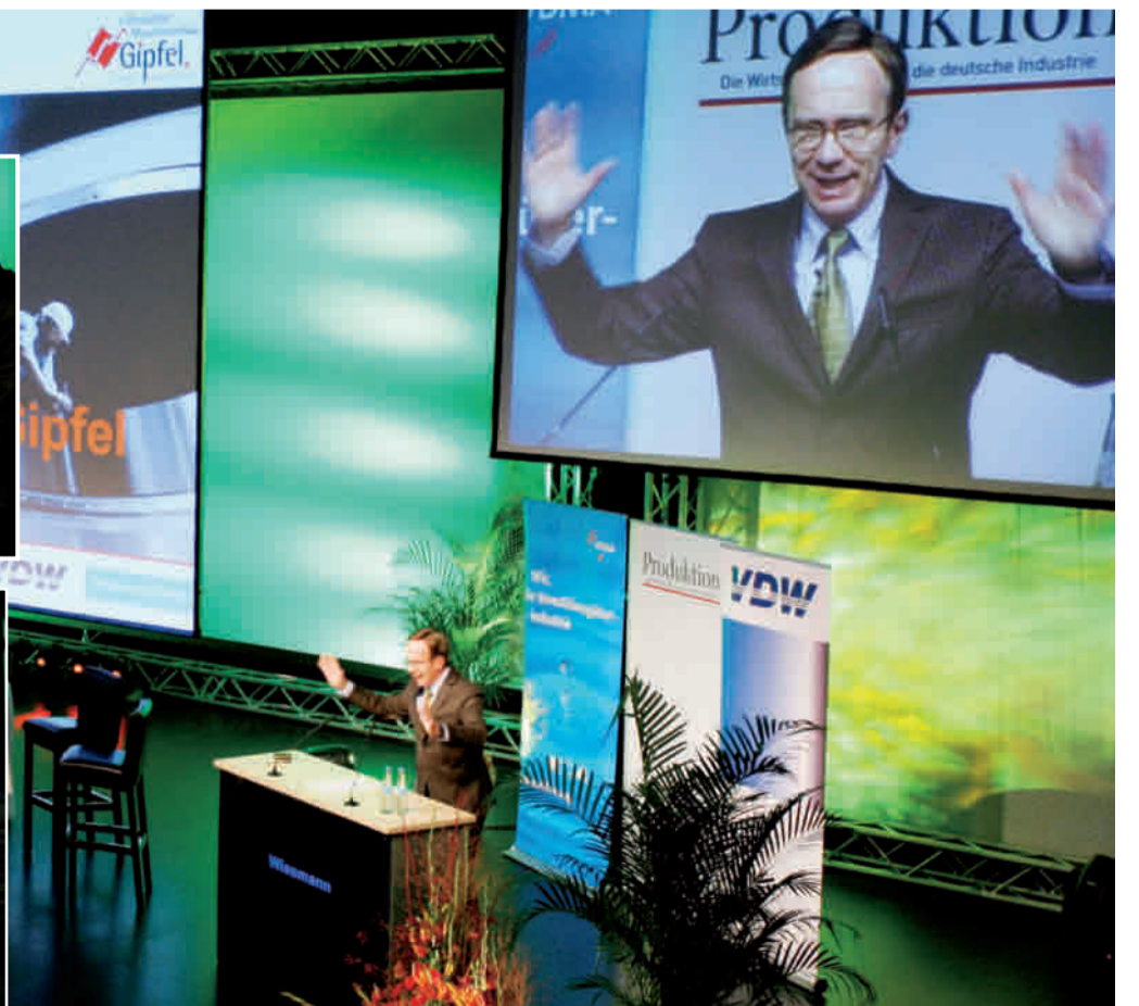
Der Präsident des Verbands der Automobilindustrie (VDA), Matthias Wissmann, dämpfte die Hoffnungen auf eine schnelle Verfügbarkeit von Elektrofahrzeugen. Die Partnerschaft von Maschinenbau und Automobilbau sei in der Krise besonders gefordert, so Wissmann. Nicht nur in China, auch auf anderen Märkten lasse sich zwar mittlerweile eine gewisse Bodenbildung in der Pkw-Konjunktur ausmachen, bei Lkw sei die Situation aber nach wie vor sehr schlecht. Insgesamt werde 2010 noch ein schwieriges Jahr.