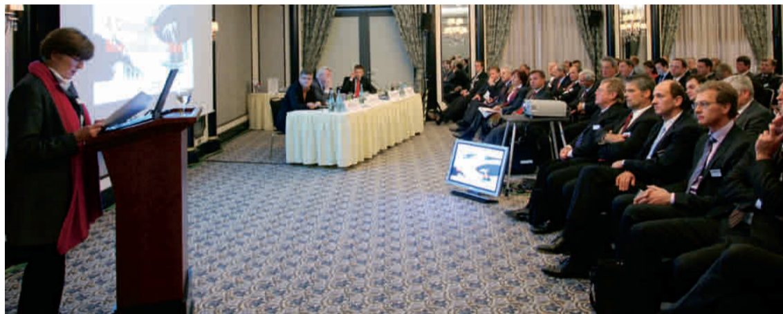
Eine große Bandbreite an Fachwissen deckten die Forenstränge in kleinerer Runde ab. Viola Groebner (l.), Direktorin ‚Wirtschaftsreformen und Industriepolitik‘ in der Europäischen Kommission, zeigte unter dem Motto ‚Fit für den Aufschwung‘ industriepolitische Ansätze der EU auf.