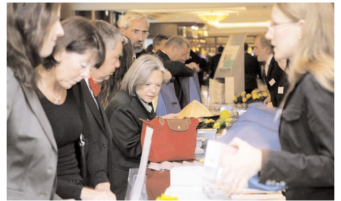
Sie standen unter Dampf, verloren aber weder die Ruhe noch die Übersicht noch ihre Freundlichkeit. Die Mitarbeiter des mic Management Information Center wickelten den Kongress mit gewohnter Souveränität und Professionalität ab.