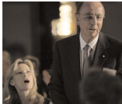
Gipfel-Moderatorin Nina Ruge: Ebenfalls sichtlich gerührt und begeistert durch die Bekanntgabe der Jury, dass Prof. Dr. Berthold Leibinger erster Träger des ‚Preis Deutscher Maschinenbau‘ ist.