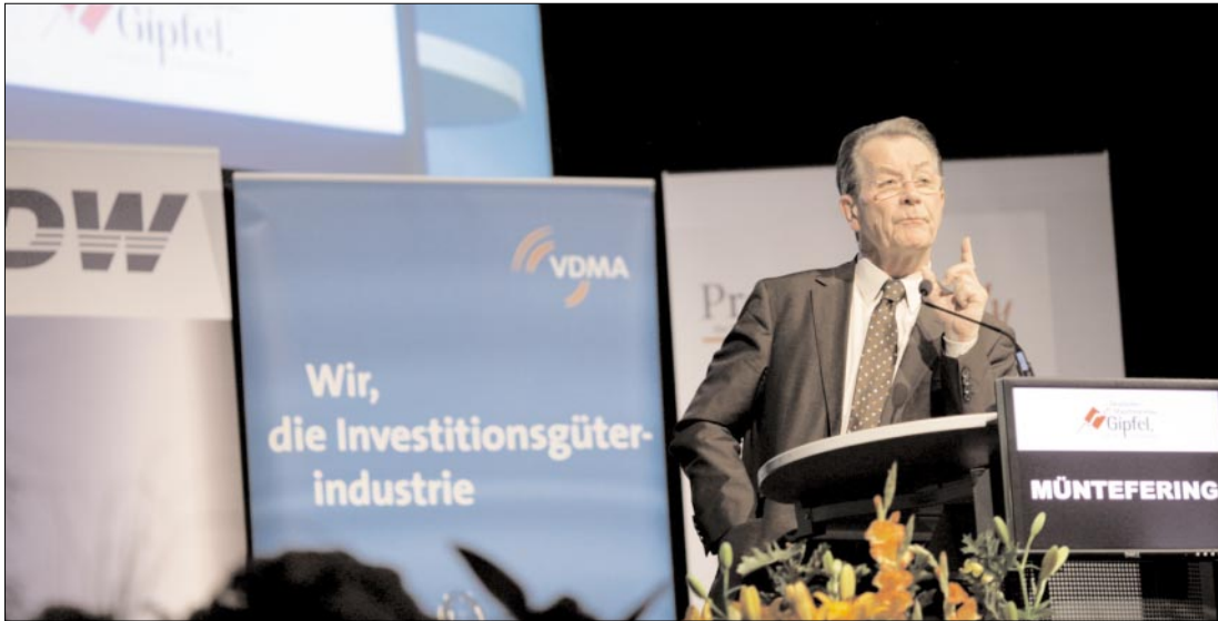
Vizekanzler Franz Müntefering , Stargast der Abendveranstaltung, bedauerte, dass er die Partikular-Interessen des Maschinenbaus nicht berücksichtigen könne. Sein Blick gelte dem gesamten, komplexeren Wirtschaftsgefüge.