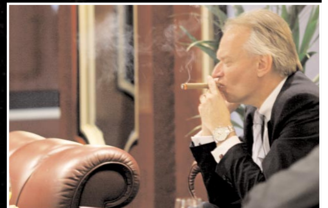
Die rote Couch der Wirtschaftszeitung Produktion bot für viele eine willkommene Gelegenheit zur Entspannung und zu Gesprächen. Hoch geschätzt: Der Zigarrenservice von Produktion.