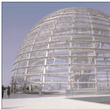
Deutschlands einziger industriepolitischer Kongress für den Maschinen- und Anlagenbau fand auch 2006 in Berlin statt. Die Ausrichter: der VDMA , der VDW sowie die Wirtschaftszeitung Produktion .