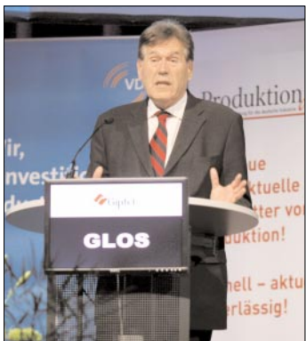
Wirtschaftsminister Michael Glos meldete den Teilnehmern positive Konjunkturdaten: Eine um 8% gestiegene Inlandsnachfrage sowie ein Wachstum von 2,5%.